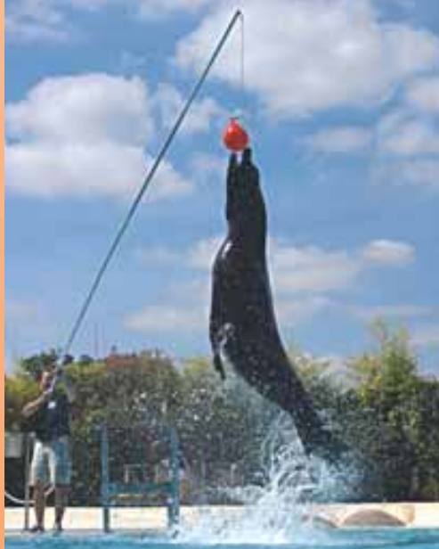
Spettacolo dello zoo parco di Beauval (Saint-Aignan)

A braccia aperte: scegliete la quiete di una locanda di campagna o il lusso di un luogo carico di storia... Ad occhi aperti: godete delle città e dei villaggi vestiti a festa appositamente per sedurvi, ogni giorno.