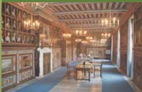
Galleria dei ritratti del castello di Beaugard

G li appassionati di Storia e gli amanti del patrimonio culturale sono accontentati. Passeggiare nel Cœur Val de Loire è come sfogliare le pagine di un libro di storia a grandezza naturale.