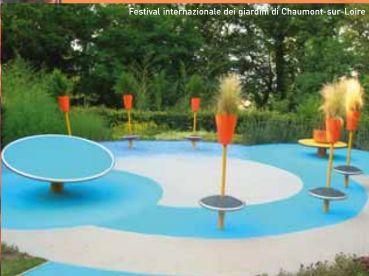
Festival internazionale dei giardini di Chaumont-sur-Loire

chiude la stagione con golosità! Il Cœur Val de Loire mette in scena tutte le sue tradizioni, la pesca e la caccia in particolare. E i bambini? Saranno coccolati! Portateli a vedere le tigri bianche e gli elefanti d'Africa allo ZooParc di Beauval, ma anche gli spettacoli dei rapaci e delle otarie... E se ne approfittate per varcare le soglie della Maison de la Magie o quelle dell'esposizione Tintin? Se ne ricorderanno per tutta la vita.