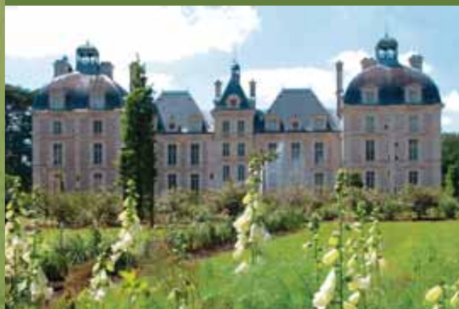
Castello di Cheverny

Seguite il cammino di Ronsard. Qui, molti sono i luoghi su cui si stende l'ombra del poeta: il maniero della Poissonnière, la sua casa natale, o il castello di Talcy, dimora della sua musa Cassandre, ispiratrice del celebre "Mignonne, allons voir si la rose..."