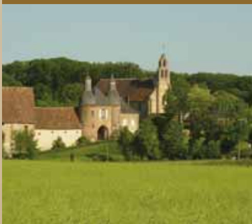
Commenda dei templari di Arville

C ontemplativo, sportivo o semplicemente curioso... il Cœur Val de Loire vi svelerà i suoi mille volti. Un mosaico di atmosfere e di possibili incontri per scoprire e godersi questa regione.