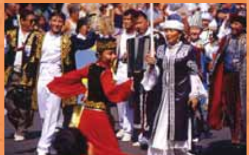
Festival dei folclori del Mondo di Montoire-sur-le-Loir

Da noi, il giardinaggio non è un semplice hobby. Pensiamo naturalmente al Festival Internazionale dei Giardini di Chaumont-sur-Loire, ma nel Cœur Val de Loire abbiamo anche 15 luoghi, raggruppati sotto il nome di Jardins Passions, che vi aprono le loro porte durante tutta la stagione.