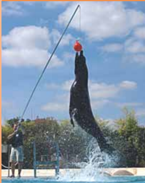
Zooparc van Beauval - Saint Aignan

M et open armen: kies voor de rust van een herberg op het platteland of voor de pracht en praal van een historisch plekje... Met open ogen: geniet van de omgeving en laat u iedere dag weer verleiden tot een bezoek aan de omliggende steden en dorpen.