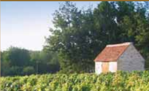
Wijngaard in de vallei van de Cher

Van nu af aan is dit de droomwereld voor uw vakanties, uw weekendjes, dus laat uw fantasie de vrije loop. Stel u eens voor met paard en wagen rustig door het gebied van de Perche te rijden langs een landhuis en een commanderie... en vlakbij kunt u de vallei van de Loir ontdekken met zijn pittoreske dorpen en de typische grotwoningen.