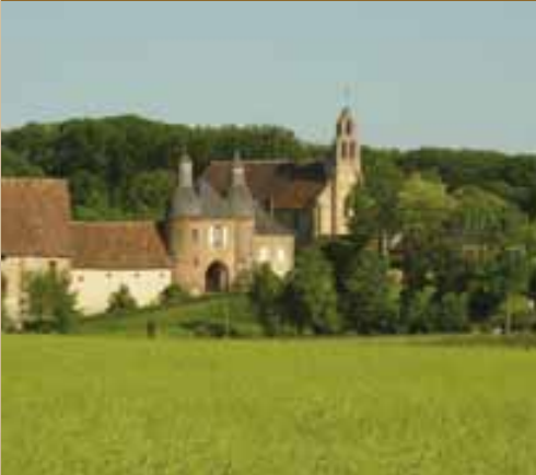
Commanderie d'Arville in de streek van de Perche

D e Cœur Val de Loire is rustgevend en tegelijkertijd sportief, gewoonweg uitzonderlijk... en het past zich aan elk ritme aan. Een groot sferenscala en al even zoveel verschillende mogelijkheden om dit gebied te ontdekken en ervan te genieten.