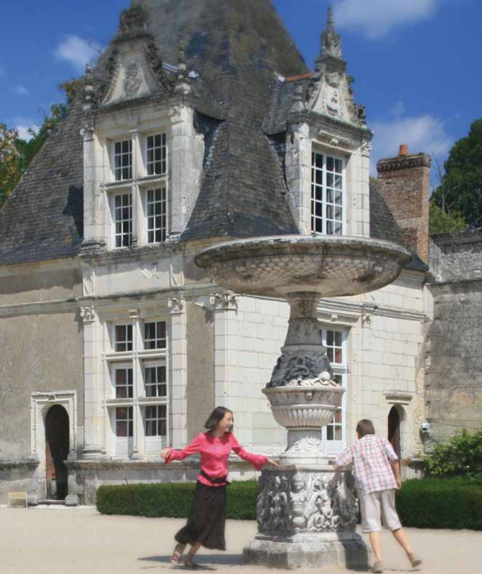
De Cœur Val de Loire, culturele rijkdom binnen handbereik