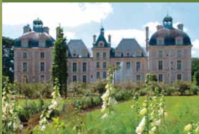
Kasteel van Cheverny

Wandelen in de voetsporen van Ronsard. De aanwezigheid van deze dichter is in deze streek overal voelbaar: het landhuis la Poissonnière, zijn geboortehuis, het kasteel van Talcy, waar zijn muze Cassandre woonde, die zijn inspiratie is geweest voor het beroemde "Mignonne, allons voir si la rose..."