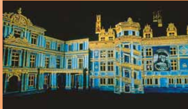
Klank en lichtspel van het kasteel van Blois

En de kinderen worden verwend! Neem ze mee naar de witte tijgers of de Afrikaanse olifanten in het ZooParc van Beauval, waar ook optredens met roofvogels en zehonden georganiseerd worden... Maar u kunt ook met uw kinderen een bezoekje brengen aan het Maison de la Magie (toverhuis) of de expositie over Kuifje. Dat zullen ze zich hun hele leven herinneren.