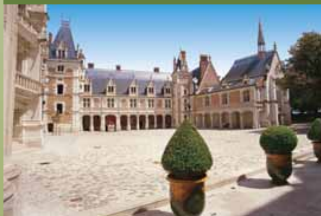
Kasteel van Blois

Cheverny te bewonderen dat een goed beeld geeft van de rijkdommen van de aristocratie en zijn tradities. En tenslotte kunt u aan de andere kant van een Engels aandoend park dat over de Loire uitkijkt, het kasteel van Chaumont-sur-Loire bewonderen, dat ongeëvenaard boven alles uittoert.