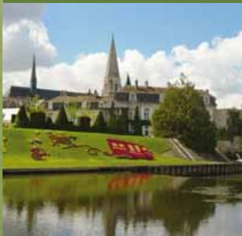
Vendôme heeft het label "stad van kunst en geschiedenis"

behalve deze internationaal bekende meesterwerken, getuigen ook minder opvallende, maar evenzo prachtige werken van de historische rijkdom van deze streek, zoals de middeleeuwse stadskern van Montrichard of van Mennetou-sur-Cher. Iets kleiner maar ook intiemer zijn de kastelen van Beauregard, van Chémery, maar ook die van Fougères-sur-Bièvre, Moulin, Troussay en Villesavin.