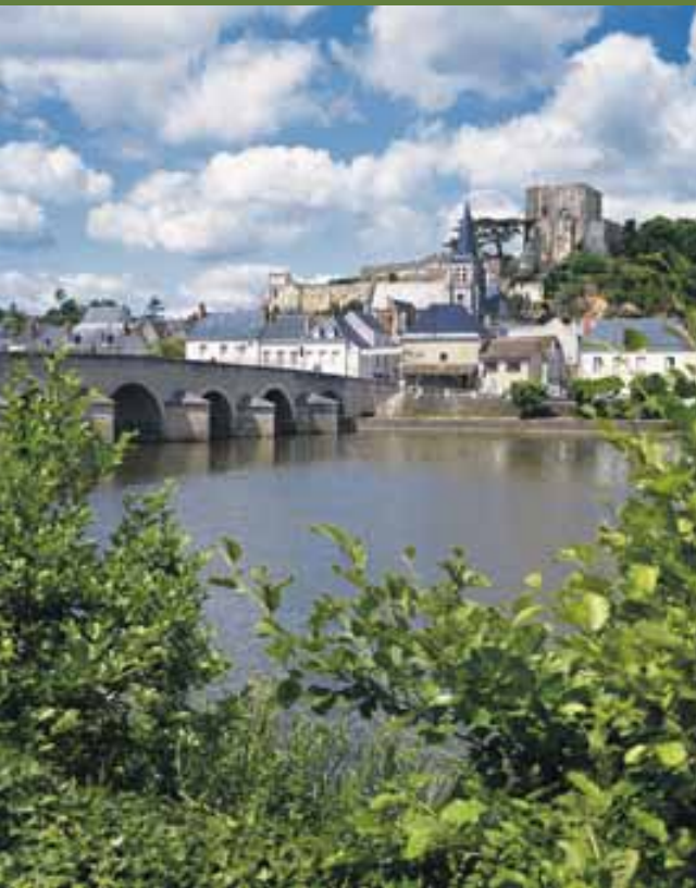
De middeleeuwse stad Montrichard