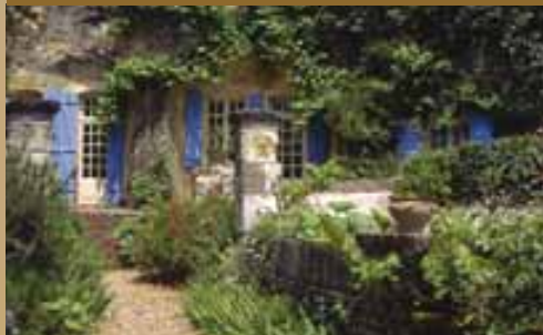
Grotwoningen in de vallei van de Loir

Proef de streekproducten van de oevers van de Cher. De wijnroute leidt u via wijnkelders naar wijnhuizen, waar u kaas op een vers stukje brood kunt proeven.