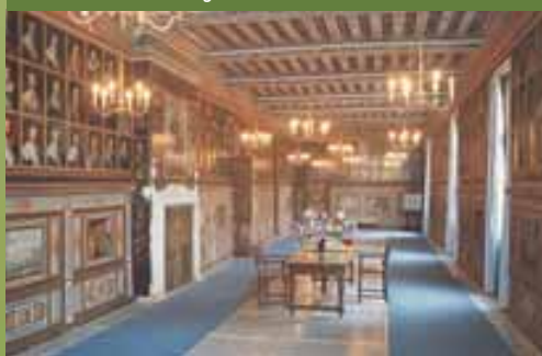
Kasteel van Beauregard

Liefhebbers van geschiedenis en erfgoed kunnen hier hun hart ophalen. Want een tocht maken door de Cœur Val de Loire is als het doorbladeren van een wereldgroot geschiedenisboek.